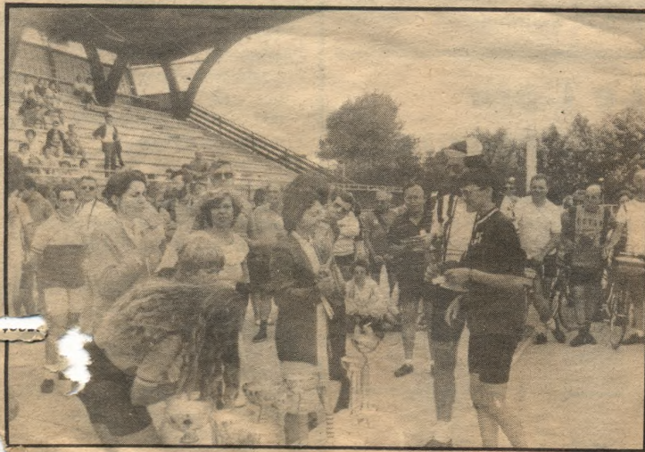
Après l'effort, la distribution des prix