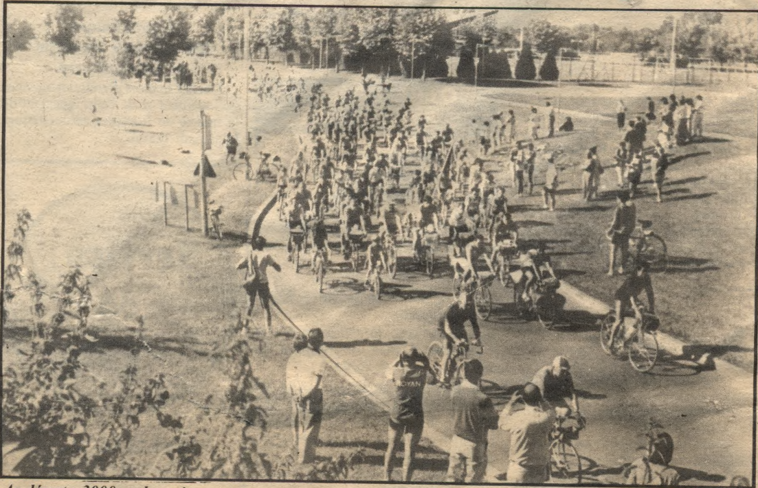
Au départ : 3000 cyclotouristes