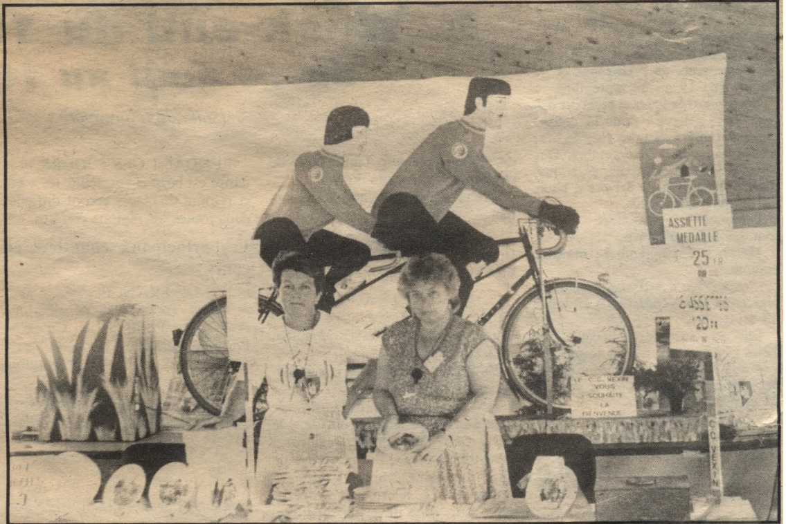
Le rassemblement dans le stade

Vers 13 h, un repas de clôture fut servi au hall d'exposition. Un pari gagné qui obtint un grand succès malgré un temps peu clément.